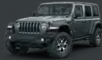
Granite Crystal Metaliczny