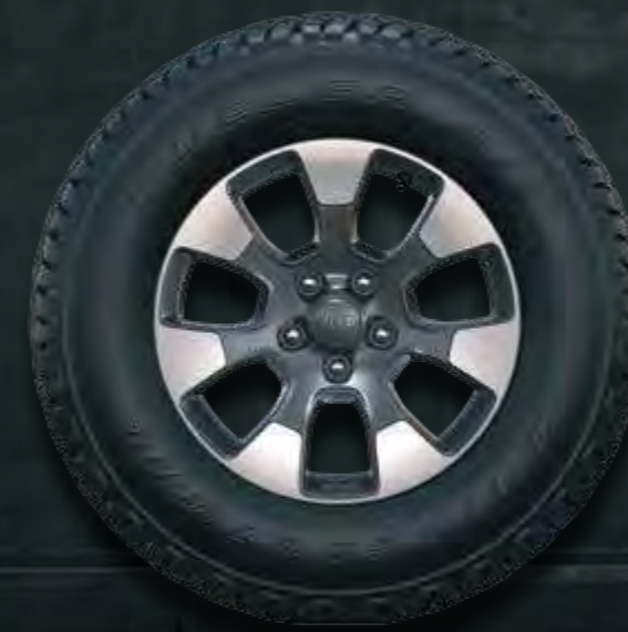
18-CALOWE OBRĘCZE KÓŁ W KOLORZE TECH GRAY Opcja Sahara (dostępne w pakiecie Overland i z silnikiem benzynowym 2.0)