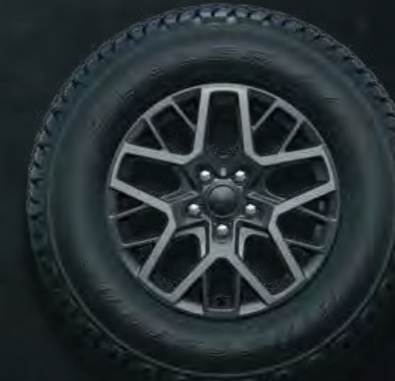
18-CALOWE POLEROWANE OBRĘCZE KÓŁ W KOLORZE TECH GREY Standard Sahara 4xe