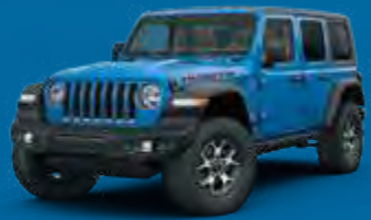
Hydro Blue Perłowy