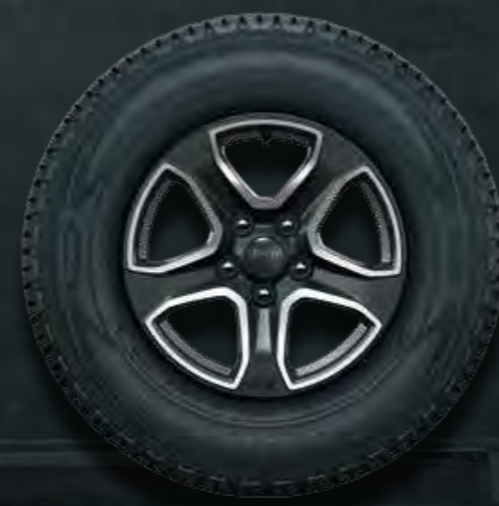
17-CALOWE OBRĘCZE KÓŁ W KOLORZE GRANITE CRYSTAL Standard Sport