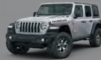
Billet Silver Metaliczny